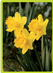
Nergis, yabani nergis Narcissus

NONNA ANNA® ist ein ganzheitliches pädagogisches Konzept zur Betreuung von demenziell erkrankten und hochaltrigen Menschen. Die Beschäftigungsmethode wurde von Bianca Mattern auf Grundlage der Erkenntnisse und Wirkungsweisen der Montessori-Pädagogik entwickelt. Über Schlüsselreize gelingt es Pflegenden und Angehörigen, sowohl verbal als auch nonverbal biografische Eckdaten zu erfahren und darüber zu tieferen Einblicken in die Bedürfnisse der Gepflegten zu gelangen. Auf diese Weise schafft das NONNA ANNA®-Material Verständigung und Verständnis und macht den Alltag wieder mit allen Sinnen aktiv erlebbar. Die humorvollen Comic-Anleitungen erklären das Material unkompliziert, effizient und sprachbarrierefrei.